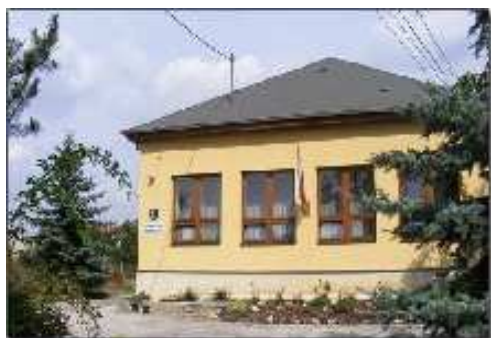
Obecný úrad Podhorany

Obec Podhorany Mechenice 51 951 46 Podhorany